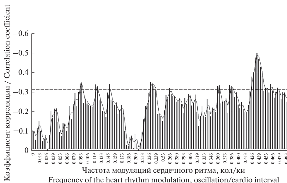
Рис. 1. Связь периодограммы сердечного ритма на различных частотах (колебаний на кардиоинтервал) с уровнем десинхронизации ЭЭГ в левом центральном отведении при выполнении КФП “Часы с поворотом”. Штриховая линия – уровень достоверности корреляции больше 95%.

Fig. 1. Correlations between periodogram of heart rhythm on various frequencies (oscillation/cardio interval) and levels of EEG desynchronization in the left central lead in the psychophysiological test – “Clock with a turn”. The note: the dashed line - the level of significance of correlation is more than 95%.