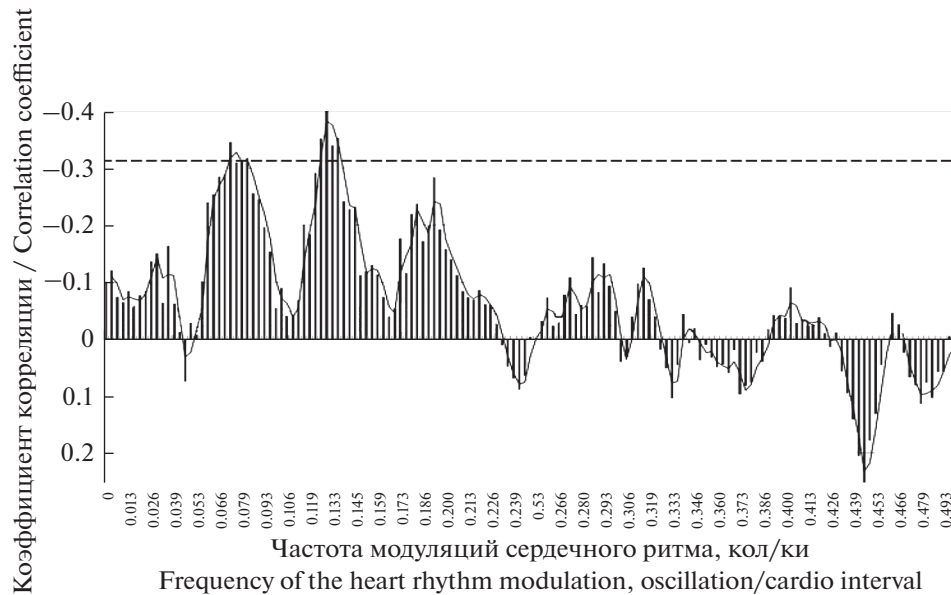
Рис. 3. Связь периодограммы сердечного ритма на различных частотах (колебаний на кардиоинтервал) с уровнем десинхронизации ЭЭГ в левом центральном отведении при выполнении КФП “Устный счет”. Штриховая линия – уровень достоверности корреляции больше 95%.

Fig. 3. Correlations between periodogram of heart rhythm on various frequencies (oscillation/cardio interval) and levels of EEG desynchronization in the left central lead in the psychophysiological test – “Mental arithmetic”. The note: the dashed line - the level of significance of correlation is more than 95%.