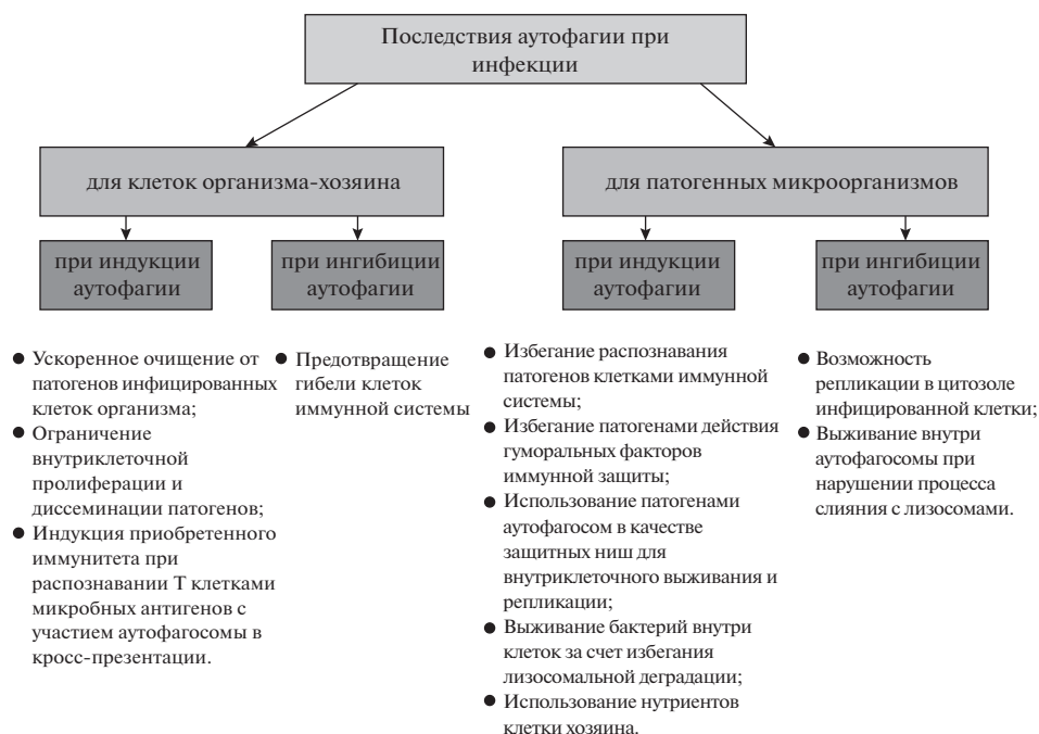
Рис. 2. Последствия аутофагии при инфекции.

HSV клетках развивается полноценный аутофагический ответ. Вирус герпеса (HSV-1) способен связывать Beclin-1 и ингибировать формирование АФ. Другие вирусы: HIV-1, вирус гриппа А, вирус коксаки В3, полиовирус ингибируют аутофагию, блокируя созревание или деградацию АФ. Многие вирусы выработали стратегии прямого или опосредованного нарушения аутофагии, чтобы использовать ее на разных стадиях вирусного жизненного цикла. К провирусным эффектам аутофагии относятся: предоставление аутофагией мембранной платформы для репликации вируса, сборки и выхода из клетки, предоставление ресурсов энергии для вирусной репликации. Аутофагия усиливает репликацию HSV за счет ингибирования иммунного ответа. Путь аутофагии пересекается с биосинтезом белков вируса HIV-1 и регулирует вирусную нагрузку в макрофагах [68]. Деградация вируса кори при аутофагии способствует презентации вирусных пептидов и развитию адаптивного протективного иммунитета [2].