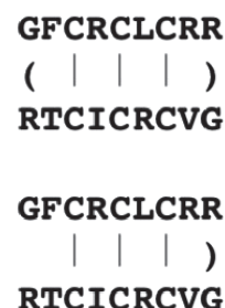
Рис. 2. \theta -Дефензин-1 (RTD-1) макаки-резус в его естественной циклической (А) и искусственной “открытой” (Б) формах.

Молекулы АМП накапливаются на поверхности клеточной мембраны, образуют липид-пептидные комплексы и создают ионные каналы, а молекулы АМП выполняют роль внутренней выстилки таких каналов [38, 41, 42]. Например, с анионными областями на поверхности бактерий связываются человеческий кателицидин и бактериоцины, продуцируемые